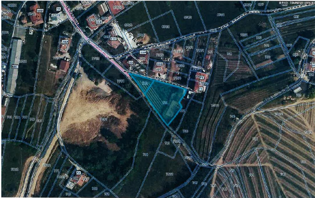
erilo 1: 1890