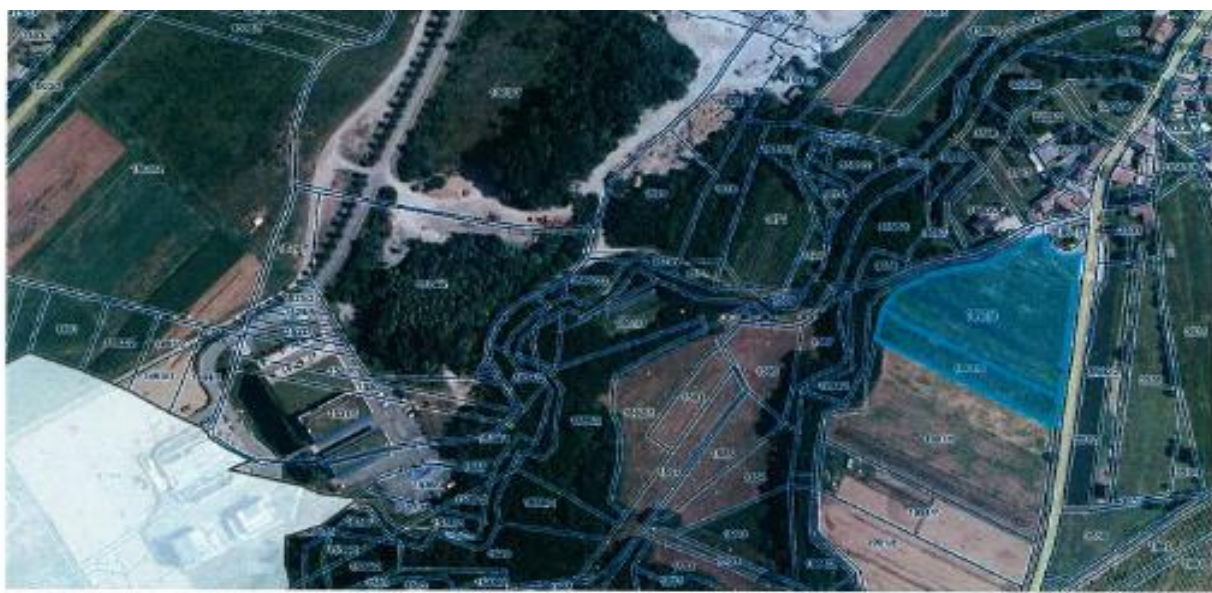
menko 1: 5780 SKICA 1 referenčna linija 10 cm

občina želi na nepremičnini s parc. št. 1992/2 in 2317/5 k. o. 2316 Vrtojba, v naravi obstoječi jarek ob lokalni cesti LC 414041 Vrtojba-Križcjan, ki je v lasti RS in upravljanju Sklada kmetijskih zemljišč in gozdov RS izvesti kolesarsko pot, skladno z načrtom IDZ, ki ga je izdelalo podjetje Biro Črta d.o.o.. Pri geodetski izmeri se je izkazalo, da predvidena kolesarska pot posega tudi na zemljišče s parc. št. 1991/4 v približni izmeri 30 m 2 in na zemljišče s parc. št. 1991/5 v približni izmeri 10 m 2 , obe k. o. Vrtojba. Po končani parcelaciji se predlaga nakup navedenih zemljišč; skica 1,2.