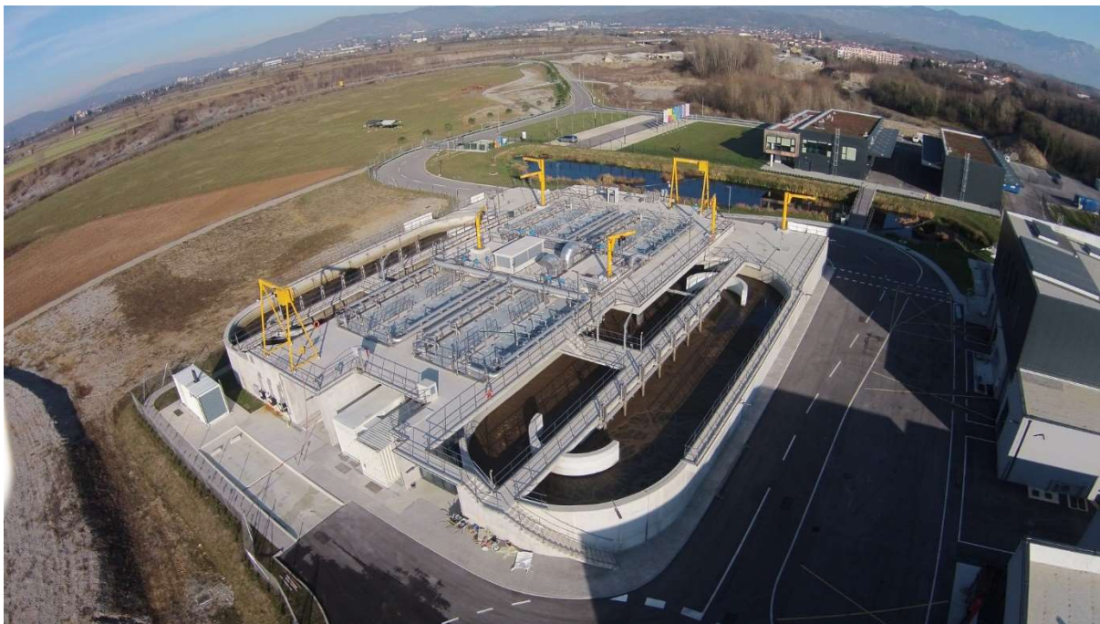
Slika 6.1: Lokacija kjer se izvaja ultrafiltracija

Mikrolokacija izvedbe menjav membranskih sklopov je prikazana na naslednji sliki.